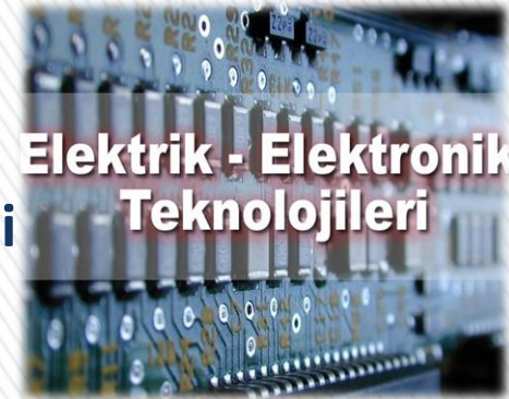
Elektrik - Elektronik Teknolojileri