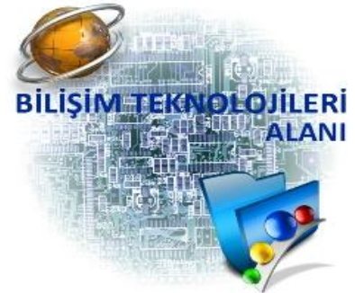
BİLİŞİM TEKNOLOJİLERİ ALANI